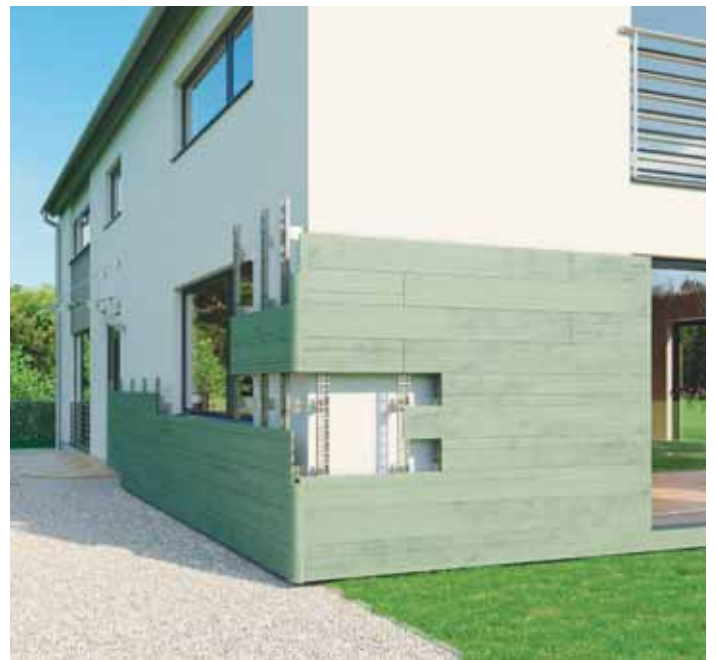
Dämmen und gleichzeitig die Optik des Eigenheims verschönern: Eine Holz-Faser-Fassade in hinterlüfteter Ausführung ermöglicht beides.

Eckelemente, L-Profile, Fugendistanzhalter und weitere Zubehör-Lösungen runden das System ab. Das geringe Eigengewicht der Komponenten erleichtert Handling und Transport, ein Klicksystem sorgt für die rasche, einfache Montage.